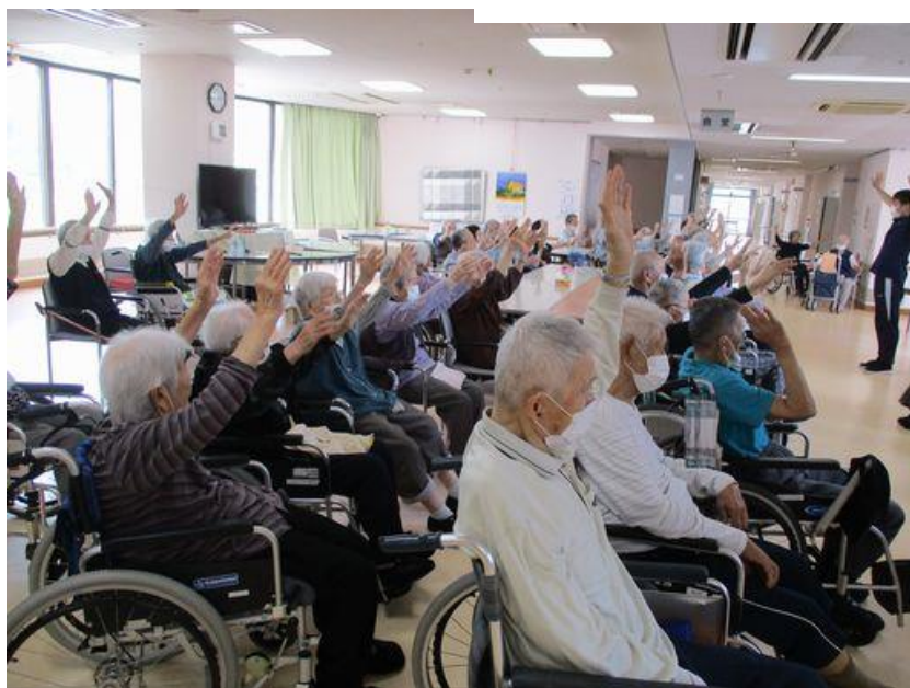
音楽に合わせてイチ・ニッ・サン♪